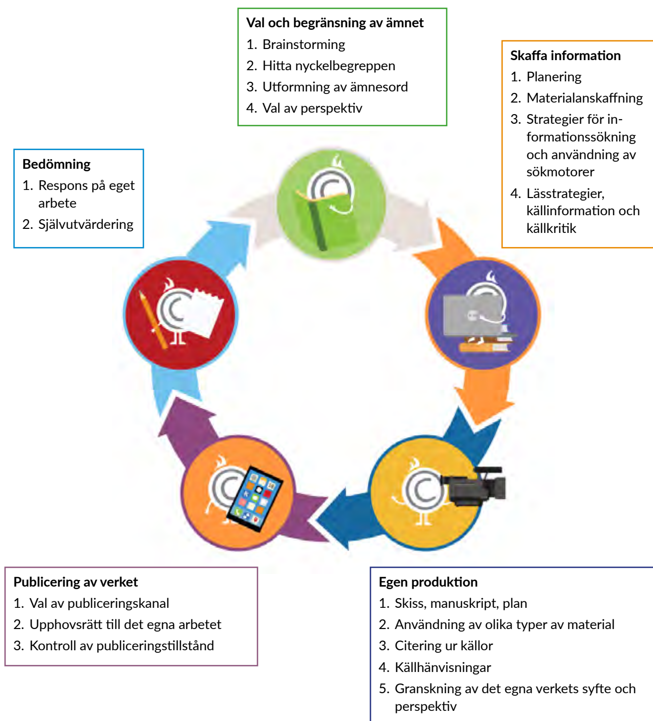
BILD 5. Den studerandes eget arbetes stig

Upphovsrelaterade kunskaper och färdigheter är en del av multilitteraciteten, eftersom de behövs i kreativt skapande när man 1) använder, 2) producerar och 3) delar innehåll. Processen för det kreativa skapandet följer projektarbetets olika skeden, som beskrivs i materialet om kreativt skapande (BILD 5). Modellen kan användas i vilken kurs som helst där man arbetar med olika slags projektarbeten.