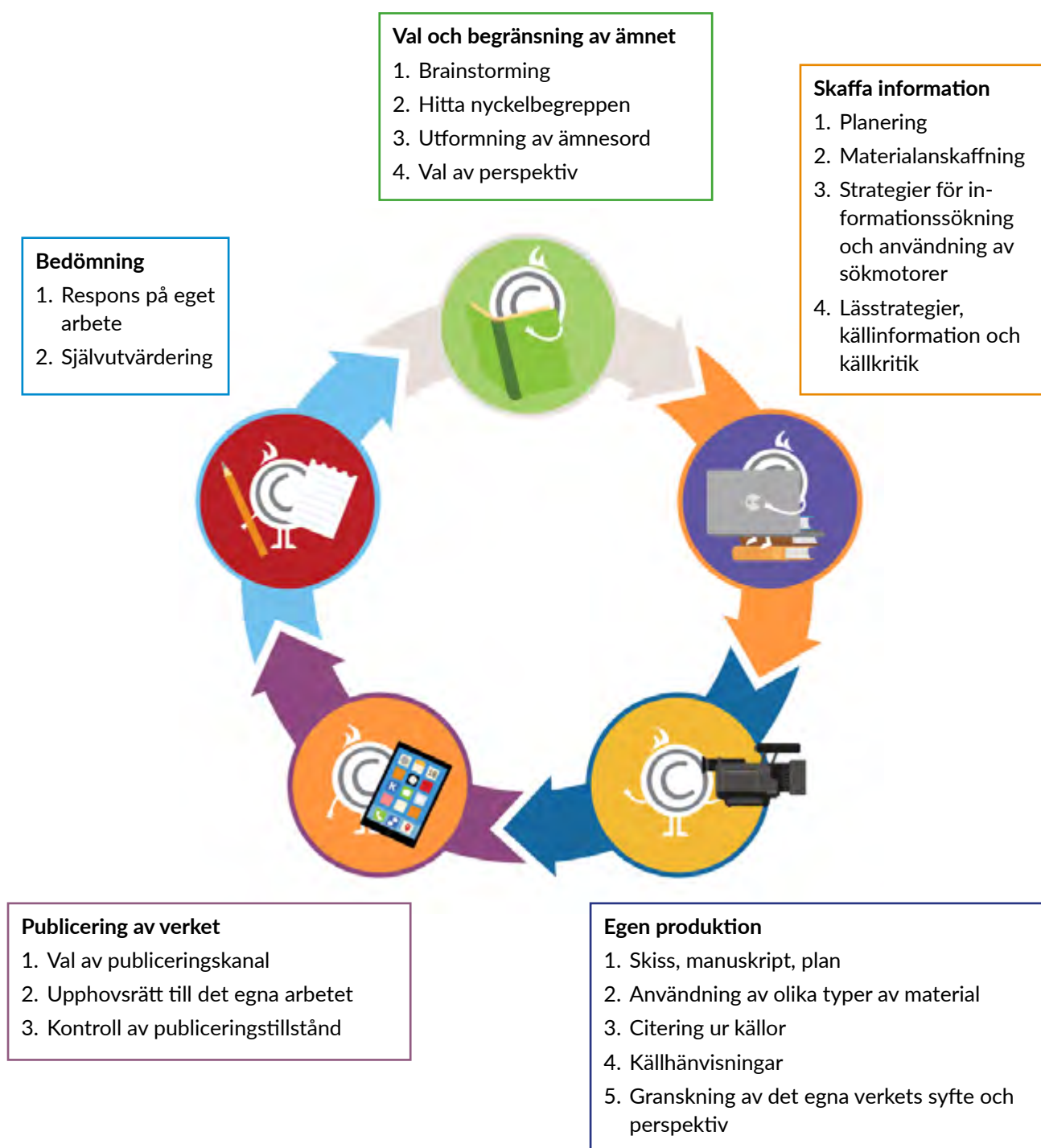
BILD 5. Den studerandes eget arbetes stig

Upphovsrättsrelaterade kunskaper och färdigheter är en del av multilitteraciteten, eftersom de behövs i kreativt skapande när man 1) använder, 2) producerar och 3) delar innehåll. Processen för det kreativa skapandet följer projektarbetets olika skeden, som beskrivs i materialet om kreativt skapande (BILD 5). Modellen kan användas i vilken kurs som helst där man arbetar med olika slags projektarbeten.