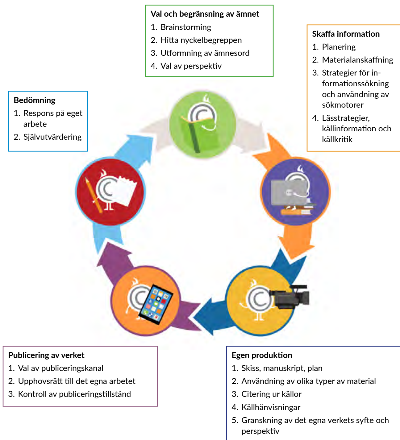
BILD 5. Den studerandes eget arbetes stig

Upphovsrättsrelaterade kunskaper och färdigheter är en del av multilitteraciteten, eftersom de behövs i kreativt skapande när man 1) använder, 2) producerar och 3) delar innehåll. Processen för det kreativa skapandet följer projektarbetets olika skeden, som beskrivs i materialet om kreativt skapande (BILD 5). Modellen kan användas i vilken kurs som helst där man arbetar med olika slags projektarbeten.