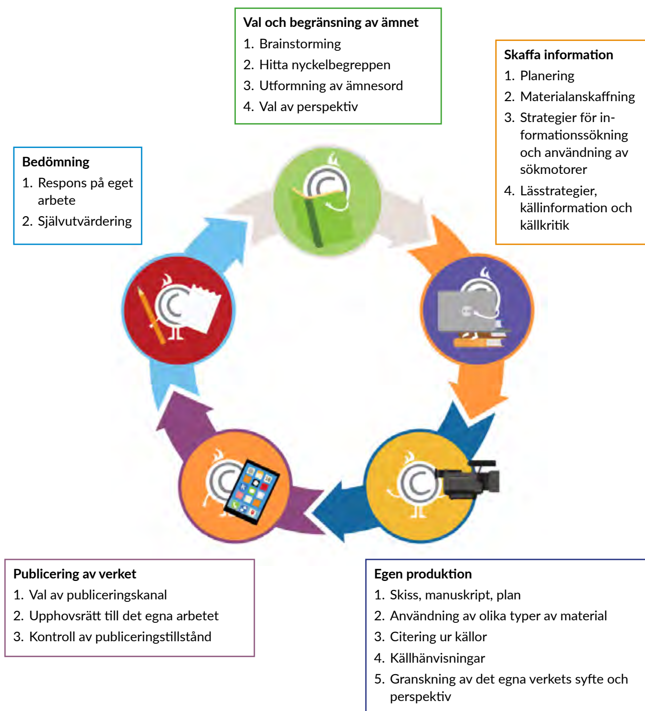
BILD 5. Den studerandes eget arbetes steg

Upphovsrätsrelaterade kunskaper och färdigheter är en del av multilitteraciteten, eftersom de behövs i kreativt skapande när man 1) använder, 2) producerar och 3) delar innehåll. Processen för det kreativa skapandet följer projektarbetets olika skeden, som beskrivs i materialet om kreativt skapande (BILD 5). Modellen kan användas i vilken kurs som helst där man arbetar med olika slags projektarbeten.