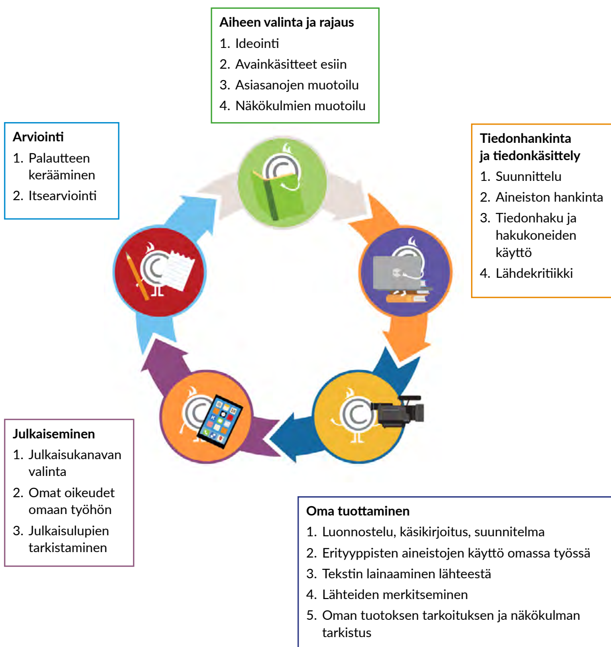
KUVIO 5. Opiskelijan oman tuottamisen polku

Tekijänoikeuteen liittyvät tiedot ja taidot ovat osa monilukutaitoa, sillä tekijänoikeuksiin liittyvää osaamista tarvitaan luovassa tuottamisessa 1) sisältöjen käyttämisessä, 2) sisältöjen tuottamisessa sekä 3) sisältöjen jakamisessa. Luovan tuottamisen prosessi noudattaa projektityöskentelyn vaiheita, jotka on mallinnettu luovan tuottamisen materiaalissa (kuvio 5). Mallia voi hyödyntää millä tahansa kurssilla, jossa työskennellään projektimuotoisten oppimistehtävien parissa. Opiskelijan omaa tuottamista varten laadittu malli ohjaa soveltamaan tekijänoikeustietoutta käytännön tilanteissa.