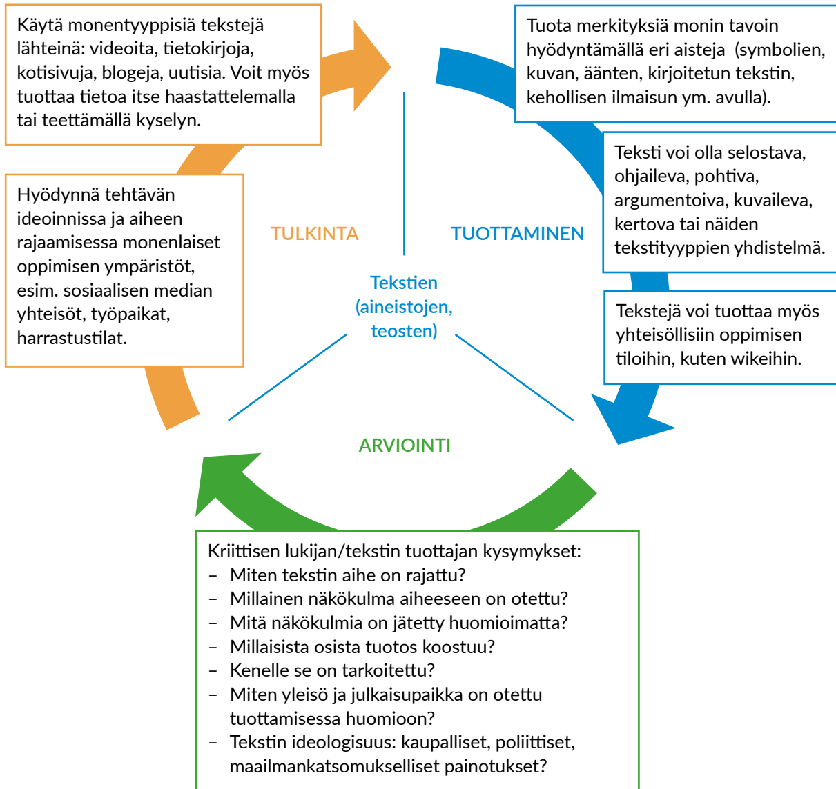
KUVIO 3. Monilukutaito oppijan omassa luovassa tuottamisessa